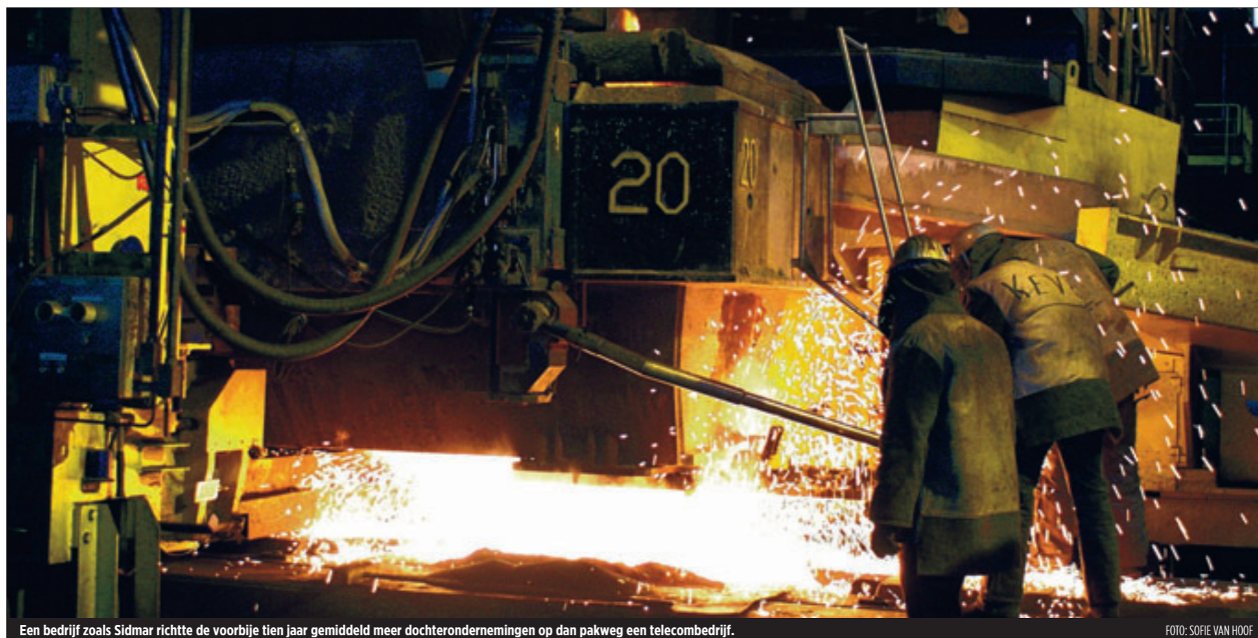
Een bedrijf zoals Sidmar richtte de voorbije tien jaar gemiddeld meer dochterondernemingen op dan pakweg een telecombedrijf.

Die verhuizing is zeker ook een van de verklarende factoren waarom vooral de verwerkende nijverheid (productiebedrijven in hout, papier, drukkerijen, chemie, kunst-